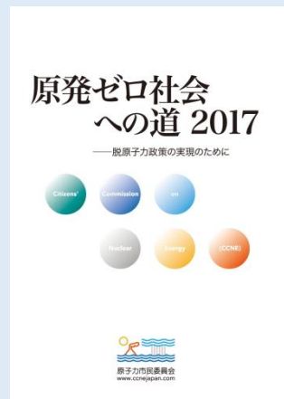
『原発ゼロ社会への道2017——脱原子力政策の実現のために』 http://www.ccnejapan.com/?p=8000 2017年12月発行