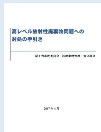
『高レベル放射性廃棄物問題への対処の手引き』 http://www.ccnejapan.com/?p=7581 2017年4月発行