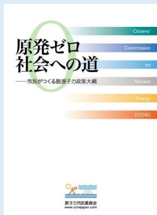
『原発ゼロ社会への道——市民がつくる脱原子力政策大綱』 http://www.ccnejapan.com/?p=3000 2014年4月発行