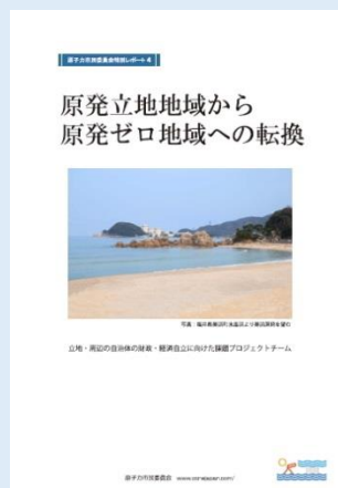
特別レポート4『原発立地地域から原発ゼロ地域への転換』 http://www.ccnejapan.com/?p=7581 2017年4月発行